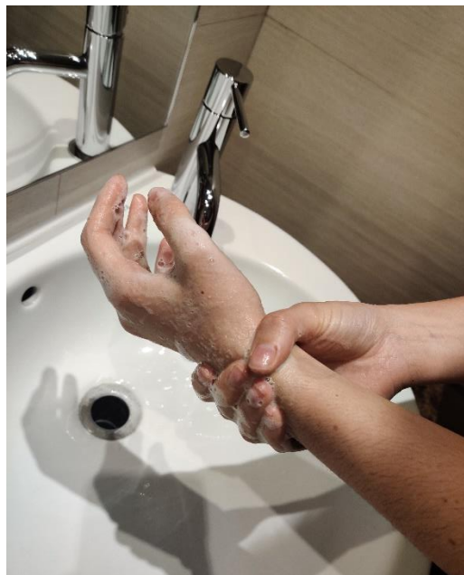
segueix rentant els canells.