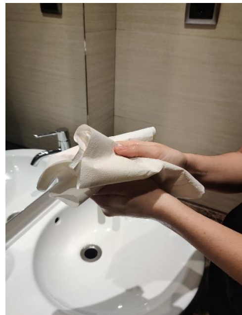
Eixuga't amb una tovallola d'un sol ús,