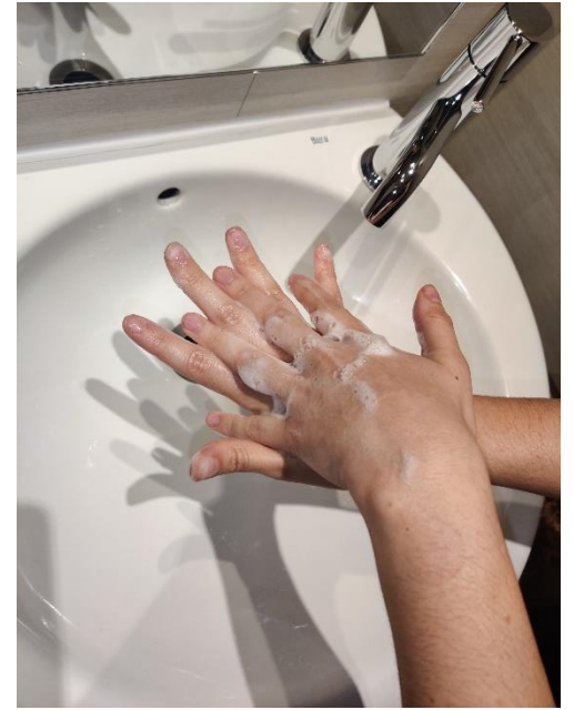
el palmell d'una mà envers el dors de l'altra, entrelaçant els dits i a l'inrevés,