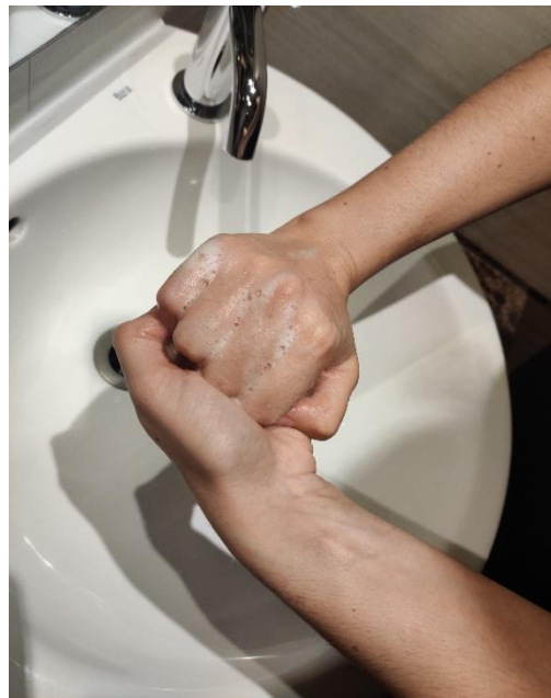
el dors dels dits amb el palmell oposat, agafant els dits,