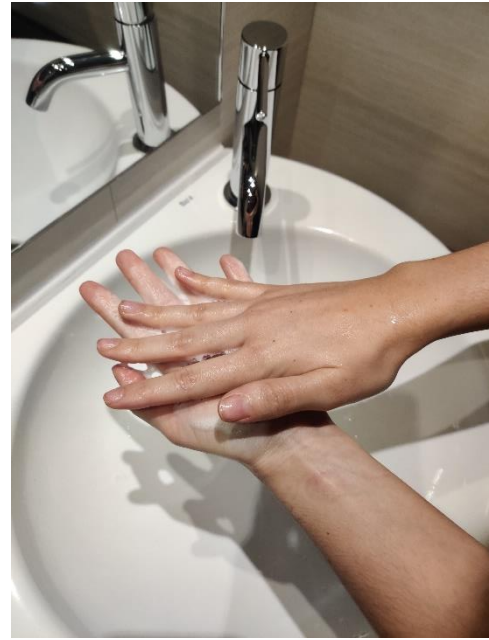
Frega els palmells entre ells,