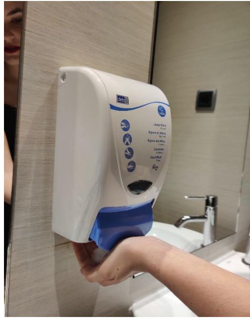
Posa suficient sabó als palmells.