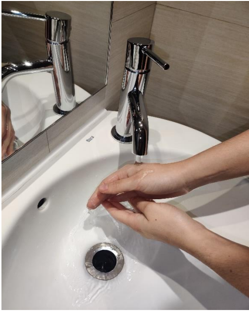
Mulla't les mans.