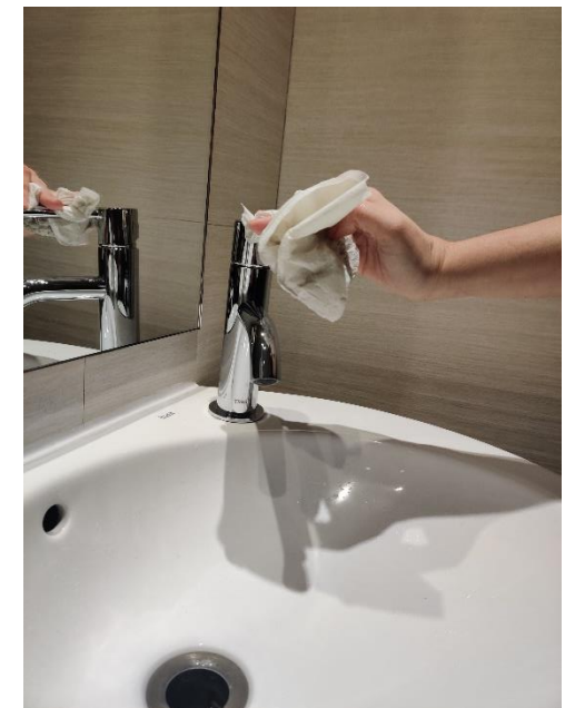
fes-ho servir per tancar l'aixeta i llença-la a les escombraries.