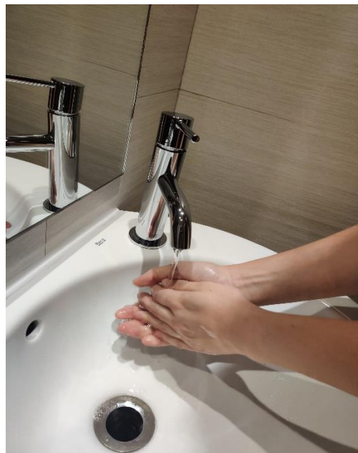
Esbandeix-te les mans.