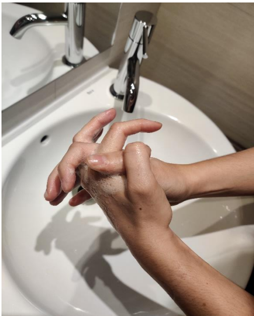
els palmells junts, amb els dits entrelaçats,